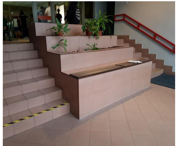
Schody do siłowni