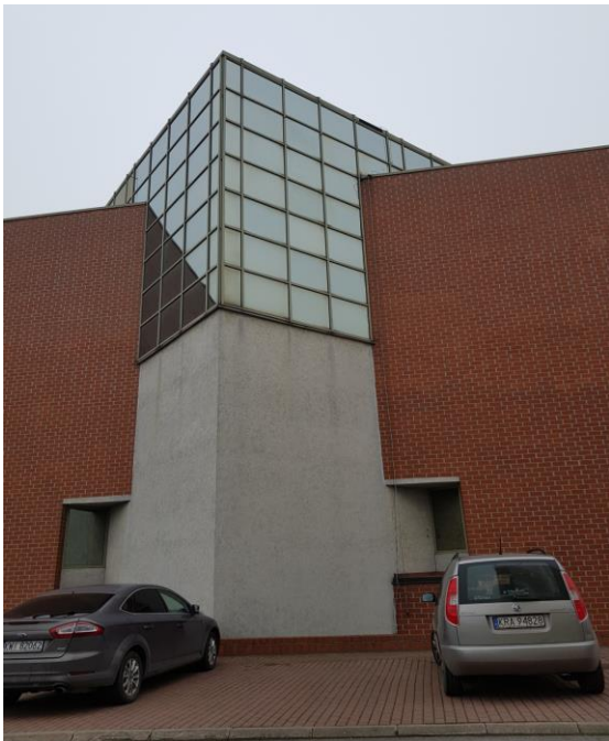
Miejsce, gdzie powstanie szyb windowy